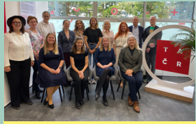
LMT vizitas Prahėje: bendradarbiavimo stiprinimas su tarptautiniais mokslinių tyrimų ir inovacijų centrais