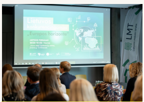
Konkurencingumas „Europos horizonte“: kokių sprendimų reikia Lietuvai?