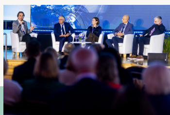
Tikslas iki 2050 m. – turtinga ir laiminga valstybė. Ar realu pasiekti?