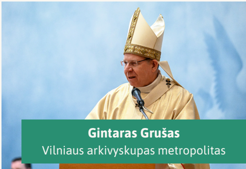
Gintaras Grušas Vilniaus arkivyskupas metropolitas

„Ir mokslas, ir tikėjimas ieško tiesos – kiekvienas savo srityje. Skirtumas tas, kad mokslas tiria kūrinių, o tikėjimas atveria Kūrėją. Kai šios dvi perspektyvos susitinka, jos viena kitą praturtina: mokslas saugo tikėjimą nuo paviršutiniškumo, o tikėjimas apsaugo mokslą nuo redukcionizmo, leidžia ieškoti tiesos giliau ir pasiekti ją išsamiau. Kartais palyginame mokslą ir tikėjimą su kopimu į kalną: mokslininkai užkope atranda teologą, sėdintį viršūnėje ir kontempliuojantį Dievą, kurį jie pasiekė savo tyrimais. Ši metafora gražiai iliustruoja, kad abi perspektyvos siekia to paties tikslo ir viena kitą papildo“ – teigia G. Grušas. Visą interviu kviečiame skaityti „Mėnesio interviu“ dalyje.