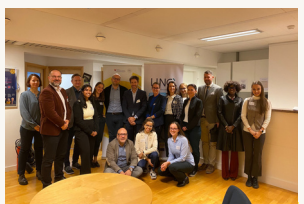
Įžvalgos ir praktika: tarptautinės kibernetinio saugumo dirbtuvės