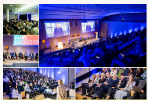
MIT ir Lietuvos mokslininkai, verslo ir politikos formuotojai kartu ieško atsakymų į ateities iššūkius