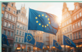
Paskutinė galimybė verslui išsakyti nuomonę dėl Europos inovacijų akto ir „28-ojo režimo“