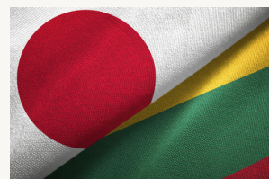
Lietuvos–Japonijos programos kvietimui pateiktas rekordinis skaičius paraiškų