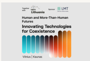
Pirmą kartą Baltijos šalyse – pasaulinio lygio ekspertai diskutavo apie gamybos ateitį, kvantines ir dirbtinio intelekto inovacijas