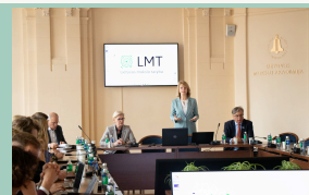
Aptarta mokslinių tyrimų ir inovacijų ekosistemos kūrimo svarba retų ligų gydymui