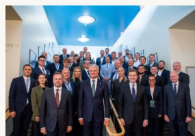
Lietuvos ir Suomijos gynybos ir saugumo forumas: stiprinami ryšiai ir kuriamos naujos partnerystės