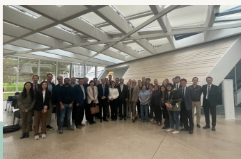
Lietuva ir Taivanas sustiprino bendradarbiavimą mokslo srityje: pristatyti bendrų tyrimų rezultatai ir ateities kryptys