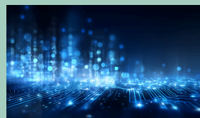
Baigėsi trečiasis kvietimas technologinės plėtros projektų paraiškoms teikti – gautos 45 paraiškos