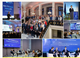
Pirmoji Tarptautinė mokslo savaitė „(re)SEARCH 2025“: Lietuva – tarptautinio mokslo dialogo centre