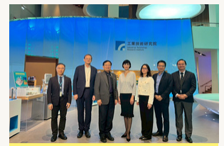
LMT ir ITRI susitikime aptarti Lietuvos–Taivano projektai ir tarptautinio bendradarbiavimo perspektyvos