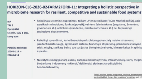
Lietuvos pareiškėjai ruošiasi 2026 m. „Europos horizonto“ paraiškų teikimui